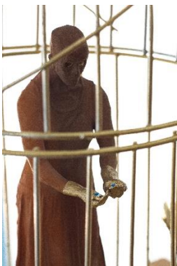
Kijkdoos 9 (Bijzaken)

Hoewel de tafereeltjes in de kijkdozen op het eerste gezicht heel speels lijken - de kunstenaar heeft zich duidelijk geamuseerd met dit creëren in minimumformaat - worden hier persoonlijke of maatschappelijke onderwerpen aangeraakt. De figuur die in een gouden kooi zit opgesloten, de 2 gespiegelde figuren die zichzelf en de ander lijken te willen afschieten, de therapeut of de portretschrijfster die een cliënt met doodshoofd op bezoek heeft (de ultieme stilstand in het gemoed) : ze laten je niet onberoerd.