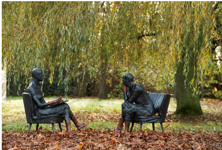
De Portrettschrijfster en de andere kant (Hoofdzaken)

Hiermee betreedt ze het domein van de poëzie, waarbij de boodschap zich 'tussen de regels bevindt'.