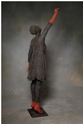
De Rode Rechterhand (Hoofdzaken)

De broosheid van onze tijd hier op aarde, en hoe snel de slinger kan omslaan van geluk naar ongeluk, van het fortuin naar het onfortuinlijke, lees ik hierin. Wat is de trigger? Door van alles te zijn zoals de beelden het uitdrukken. De lat die te hoog ligt (De rode rechterhand).