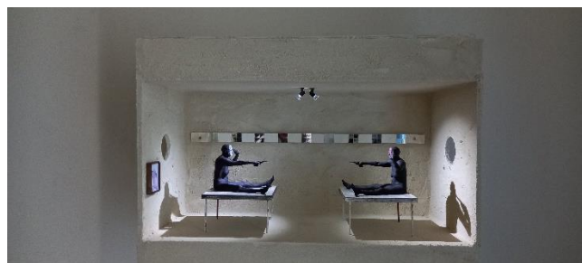
Kijkdoos 11 (Bijzaken)