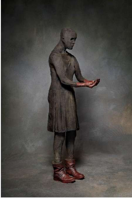
Je me voyais me voir (Hoofdzaken)