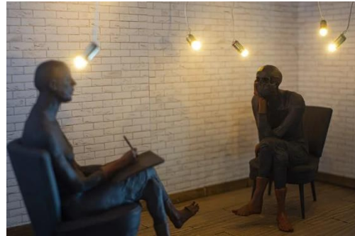
Kijkdoos De therapie (Bijzaken)

Hoewel de tafereeltjes in de kijkdozen op het eerste gezicht heel speels lijken - de kunstenaar heeft zich duidelijk geamuseerd met dit creëren in minimumformaat - worden hier persoonlijke of maatschappelijke onderwerpen aangeraakt. De figuur die in een gouden kooi zit opgesloten, de 2 gespiegelde figuren die zichzelf en de ander lijken te willen afschieten, de therapeut of de portretschrijfster die een cliënt met doodshoofd op bezoek heeft (de ultieme stilstand in het gemoed) : ze laten je niet onberoerd.